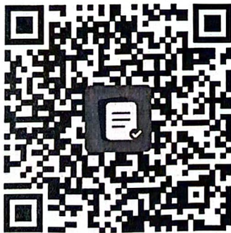
2024 儿科班报名二维码

(3) 缴费方式：扫描下方缴费二维码，转账汇款。 转账时请在备注栏备注：“2024 儿科班-学员姓名” ，请务必标识清楚，以免影响您开取发票。缴费时请提供学员名称(跟缴费备注一致)单位名称、单位纳税识别号、邮箱。