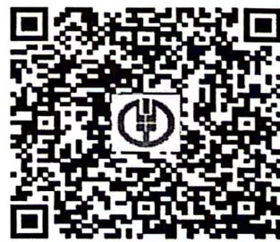
需备注：儿科学习班-学员姓名